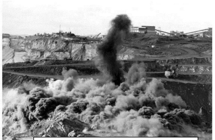
Explosión de rocas en una minera.

En base a esto vemos inocuo el desarrollo de una lucha que se canaliza en peticiones o tensiones hacia el Estado en busca de reformas, lo cual no es más que pedirle migajas a quienes nos dominan. Entendemos, como desarrollamos arriba, que todas estas devastaciones que produce el Estado son una consecuencia lógica de la dominación y la explotación. Es decir la industria plantada por los Estados y la forma de vida que se impone necesita en su desarrollo estas formas de producción y extracción de recursos, entonces no se trata de