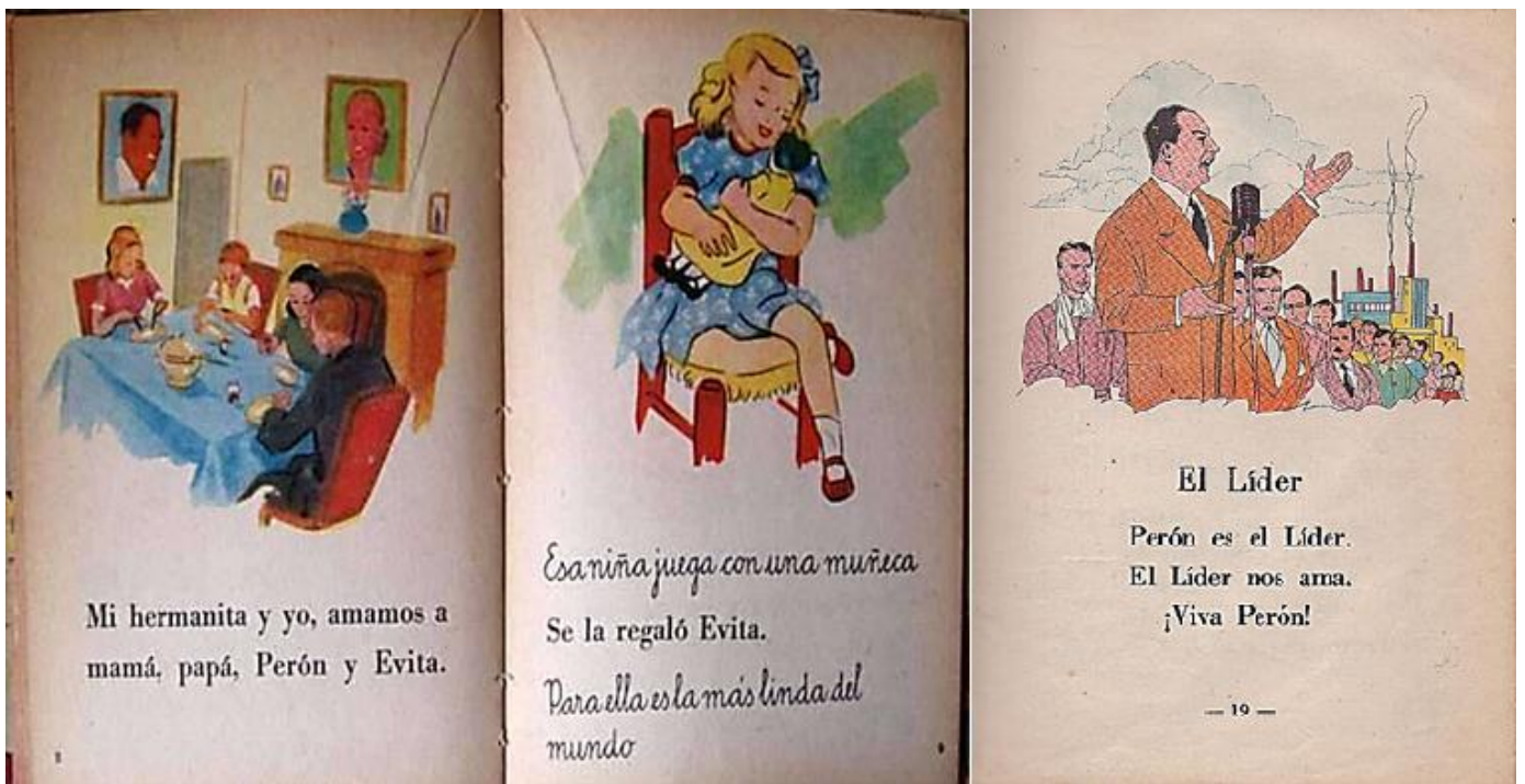
Páginas de libros de lectura para 1º y 2º grado, utilizados en las escuelas durante la primera presidencia de Perón: adoctrinamiento para el "control de masas"

El sistema moldea sus programas educativos de acuerdo a los intereses de los poderosos y nos adoctrinan en toda una serie de valores que reproducen el orden a establecer en cada territorio de acuerdo a su contexto, así podemos ver que en la Cuba "comunista" la educación tenía un tinte militar y de adoración a los comandantes de la revolución, viendo por ejemplo que para enseñar la letra f , se decía "el fusil de Fidel fue a la Sierra" o la combinación ch "los muchachos y las muchachas quieren mucho al Che". Este orden de adoctrinamiento lo expresaba, y por supuesto lo defendía, el Che Guevara en su discurso del