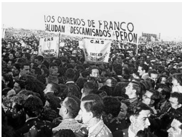
Manifestación en la España franquista de la organización sindical a fin al régimen que se impuso con la masacre sobre el pueblo español, saluda con una pancarta al peronismo.

Contra este sistema hubo y hay resistencia, contra este sistema hay y habrá lucha por una vida distinta, sin explotadores ni explotados, pero si nos hicieron pensar que el trabajo dignifica es porque el poder se mantiene mediante el adoctrinamiento y la violencia. Por ello históricamente han reprimido las luchas por un mundo sin explotación, con un discurso de la defensa del orden y la democracia defienden un sistema de privilegios. Así en la confusión y la desolación, en el individualismo y la desorganización de las personas explotadas han triunfado los ídolos, los líderes, los vendedores de ilusiones, personas como Perón, aquel militar, represor de obreros, participe del golpe militar de Uriburu e ideólogo de un fenómeno social articulado por medio del control de masas, copiado del fascismo. Por ello es que Perón se exilió en la España de la dictadura de Franco que aplastó con la masacre la revolución social de 1936 y