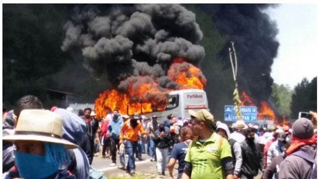
Julio 2016, México: recrudece la represión contra maestros y habitantes que se oponen a la Reforma Educativa, las manifestantes montan barricadas en San Juan Tumbio, en Pátzcuaro, Michoacán

Como razonamos desde la búsqueda consecuente con la libertad, sostenemos que un movimiento que actúe en función de la liberación no debe reproducir el castigo y la venganza sobre los que gestionan el poder, sino desarticular toda estructura de poder para que nadie pueda oprimir a