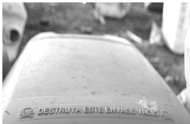
Envase de agrotóxico tirado entre muchos otros al costado de un campo, en el cual se puede leer entre dos calaveras "Destruya este envase vacío"

En la actualidad los campos de esta región están plantados en un 70% con semillas que son alteradas genéticamente, modificando su ADN, por medio de la intervención científica. Por ejemplo a un tipo de semilla de soja (principal plantación en esta región) se le inserta un componente que hace que las