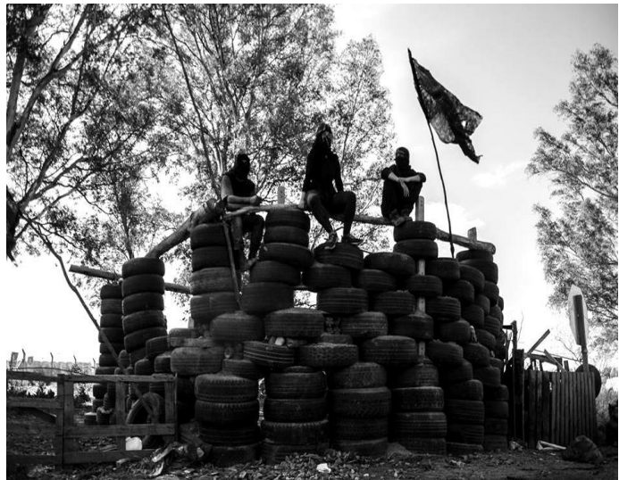
Barricada sobre el ingreso a la planta de Monsanto para impedir el acceso a la misma.