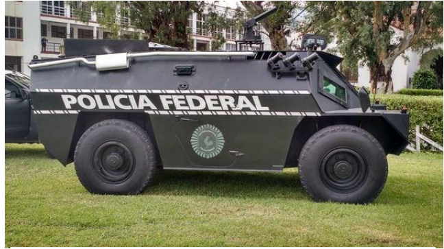
Carro blindado antidisturbios, anfibio con tronera lanza gases

A mediados de 2016 el Estado solicitó al Congreso de EEUU un pedido de compra de material bélico por más de 2 mil millones de dólares para “combatir el terrorismo”: mientras espera la aprobación de dicha venta, ya adquirió algunas armas para equipar a la policía. También planificó la utilización de alrededor de 127 millones del presupuesto público para equipar a la policía local con equipos especiales anti-disturbio para atacar manifestaciones (proyectando una compra de 1600 trajes completos de indumentaria anti-disturbio y 2600 filtros de protección para la represión con armas químicas)