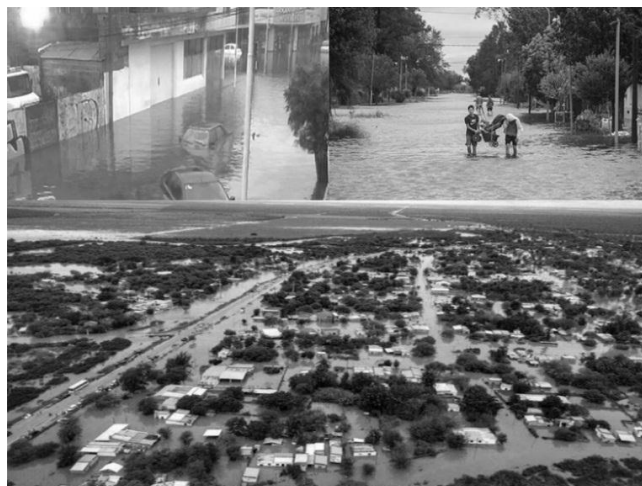
2017: las inundaciones avanzan dejando pueblos enteros bajo el agua. El Estado trata de ocultarlo para negar la catástrofe ambiental.

A su vez el uso de transgénicos y agrotóxicos, sumado a la práctica de la siembra directa y el monocultivo genera que la tierra se desgaste, debido a que no hay rotación de cultivos (siempre se planta lo mismo), tenga menos capacidad de absorción de agua y sea un tierra “desnutrida” que cada vez responde menos al crecimiento de las plantas, y por esto se intensifican