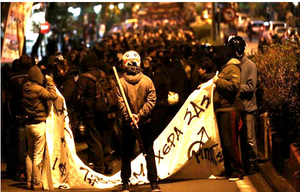
Marzo 2017: Miles de anarquistas toman las calles en Atenas contra los desalojos de edificios ocupados por anarquistas para inmigrantes que vienen escapando de la miseria y las guerras en Medio Oriente. La región dominada por el Estado griego, en los últimos 40 años ha visto crecer la tendencia hacia el anarquismo.

Está claro que podemos ser personas que aspiren a cambiar este mundo por no querer aceptar esta vida de miseria, sabiendo que en las voluntades está la posibilidad y el camino para la revolución social que nos lleve a la libertad de una vida en solidaridad, respeto y ayuda mutua.