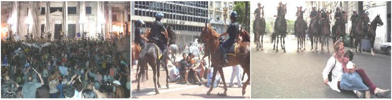
Rebelión de diciembre de 2001 en la región argentina: las manifestaciones expresan el repudio social a los políticos, resuena la consigna “que se vayan todos”. Se conforman miles de asambleas populares en todo el territorio, se crean cooperativas, se ocupan fábricas, se saquean almacenes de mercadería para socializar los productos; se viven momentos de autoorganización. El Estado se defiende con palos, gases y balas de plomo.

Con el exterminio de las guerrillas y cumplida la misión de infligir terror en la sociedad la dictadura, con una creciente deslegitimación que se agudiza aún más luego de la guerra de Malvinas, decide convocar a elecciones democráticas donde gana Raúl Alfonsín.