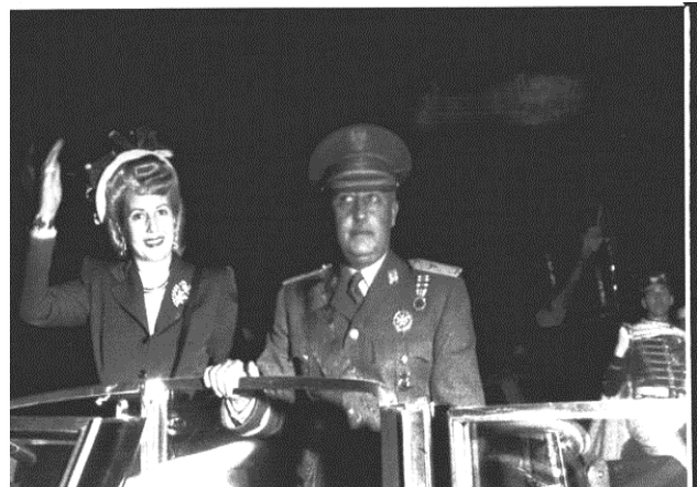
Eva Perón y el general Francisco Franco, un genocida. El régimen franquista asolo con brutal violencia la región española.

En algunas partes la explotación se ve más, en otras esta más oculta, ellos la distribuyen y la justifican con argumentos que nos enseñan en la escuela. Este es un detalle no menor del conflicto: los docentes hacen huelga, y el Estado como institución que gestiona y reproduce la realidad capitalista, exige a los docentes que regresen a los puestos de trabajo porque es mediante la educación que imparten los maestros que se educa en la normalización para la reproducción de la realidad tal cual esta. El sistema educativo reproduce los contenidos y las normas para generar la lógica ciudadana, el respeto al orden del poder, la pasividad y la resignación en las personas hacia la posibilidad de pensar libremente y rebelarse. En el colegio desde niños nos educan en el respeto y la defensa de la Patria, haciéndonos defensores de un orden criminal, la patria , un territorio conquistado y delimitado por medio de masacres a pueblos originarios (aquella “Campana del desierto” fue la masacre de miles de personas con torturas, violaciones, secuestros y desapariciones, todo para terminar de delimitar el territorio patrio ). Así nos educan en el respeto a todas esas personas que representan los valores que necesita el poder para que cada nueva generación reproduzca sus formas, de esta manera fue posible durante el primer gobierno peronista que en los colegios se eduque en el “amor” a Perón y Evita, con manuales que contenían frases como “Perón y Evita me quieren”.