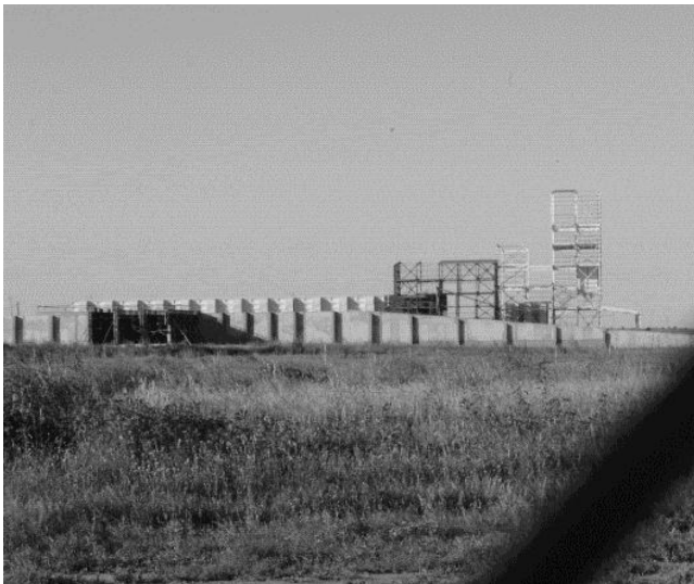
Planta que pretendía instalar Monsanto en Malvinas Argentinas, provincia de Córdoba.