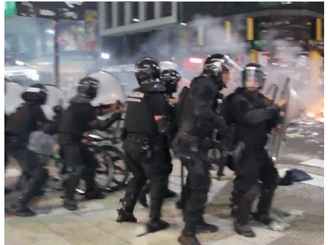
Represión a quienes ocupaban el Teatro San Martin para evitar su privatización, (conflicto de la Sala Alberdi) entre las personas heridas hubo 3 de bala de plomo.

Entre muchos otros ejemplos de lo que trasciende (mucha gente se queda callada por miedo, además de que los medios masivos de comunicación son parte del poder, y la sociedad tiene muy pocas expresiones de medios libres) podemos citar algunos ejemplos de los últimos meses; el jueves 27 de marzo, con la excusa de realizar un operativo para detener a un prófugo, la policía local irrumpió en un comedor del Movimiento Trabajadores Excluidos en Villa Caraza, partido de Lanús: rompieron todo, detuvieron a dos pibes a los cuales torturaron y luego liberaron gracias a la movilización de la gente del barrio en las puertas de la comisaria. Dentro del comedor tiraron gas pimienta y golpearon a una de las cocineras quien a raíz de estos golpes perdió su embarazo. Al respecto y saliendo al cruce del repudio social a los hechos, se expresó el titular de Seguridad de la municipalidad de