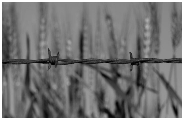
Alambrado perimetral de púa, símbolo de la propiedad privada, delimitando los campos y las tierras las cuales nos niega la economía.

necesario que tomemos conciencia, porque el destino de nuestras vidas depende en primera instancia de las voluntades que tengamos para modificar esta realidad y construir otra donde los intereses de un grupo de personas no implique el sufrimiento y padecimiento de otras.