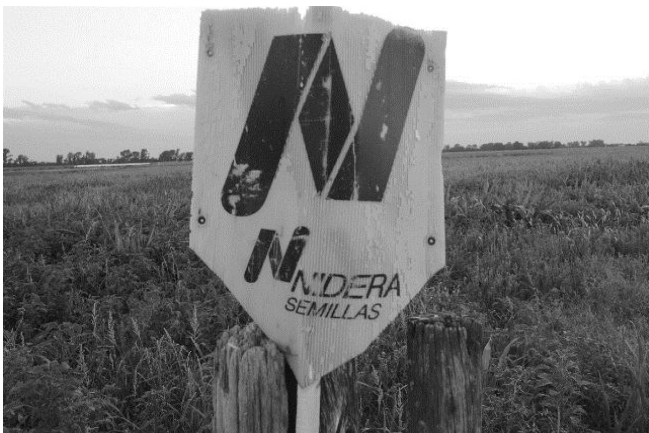
En los campos se pueden ver los carteles que indican la propiedad de las semillas

mismas plantas segreguen un veneno que mata por asfixia a los insectos que se le posan. Así podemos citar decenas de ejemplos de las intervenciones que les hacen a las plantas al fin de intensificar los intereses (anti)sociales y económicos que tienen las empresas y los Estados. Intereses basados en la producción a gran escala, más redituable económicamente, y en el hecho de mantener personas enfermas, por los problemas que este tipo de producción genera, para que dependan de la industria farmacéutica, que no por casualidad es manejada en gran parte por las mismas empresas que manejan la producción agrícola. De esta forma se da una población enferma la cual es más fácil de manipular y manejar, atados por el negocio farmacéutico. Todo pensado en términos de los intereses de los políticos y empresarios y en total detrimento de la alimentación y la salud de las personas como veremos a lo largo del texto.