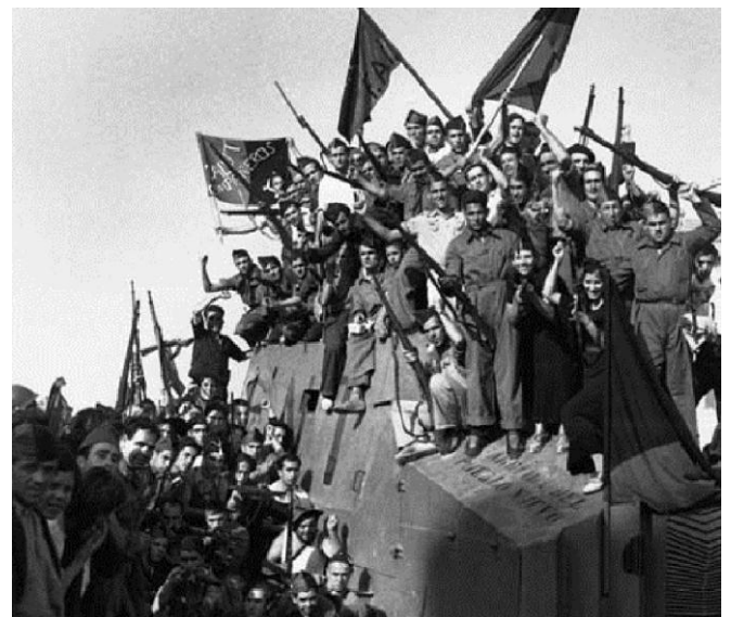
Revolución social en la región española, 1936. La policía queda abolida por el ejercicio del “pueblo en armas”. En la foto, milicianas y milicianos sobre un camión blindado por los mismos trabajadores en una fábrica metalúrgica colectivizada.

El rechazo a la policía significa que es necesario desarrollar medios para la defensa contra quienes quieran oprimir, pero una fuerza con ética de libertad no defiende a un poder, no se basa en el castigo, en la tortura del encierro y no busca limitar la libertad de las personas para sostener los privilegios de un grupo, sino que es expresión de la lucha por una convivencia armónica basada en la comprensión y la educación para que nadie oprima a nadie . Entendido esto, el problema son quienes desean oprimir y usen medios opresivos, contra estos, cada individuo tiene justificado el recurso a la autodefensa, pero sin prácticas que reproduzcan este mundo donde la venganza y el sadismo transforman a las personas en verdugos. Las luchas por la anarquía, la lucha de las personas que conscientemente buscaron y buscan una convivencia en libertad, apuntan a la revolución social porque se