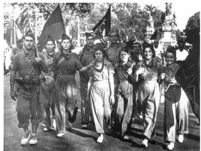
Milicias anarquistas en la España de 1936 luchando por la revolución social, luego frustrada por la reacción de los Estados fascistas, liberales y comunistas.

y esto se corresponde con la ambición de poder que reproducen muchas personas al ver como natural el pisotear a sus pares. Para cambiar esta forma de vida es que