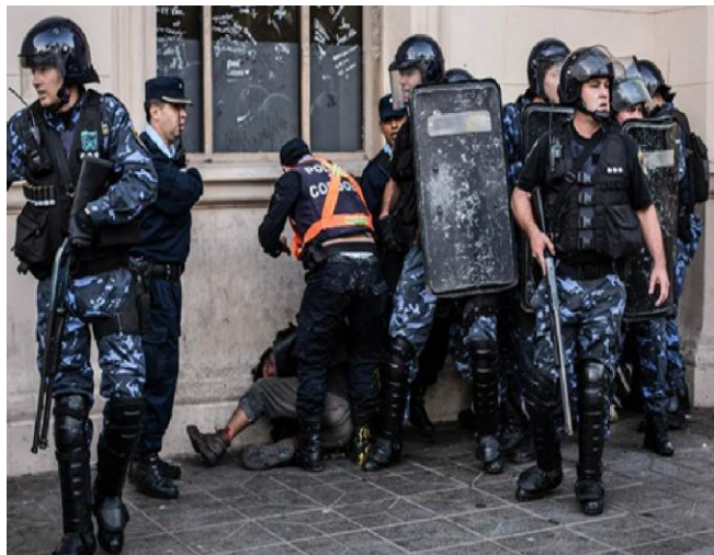
.Represión en Córdoba contra una protesta en el marco de la lucha contra Monsanto.

Este relato no se trata de un caso aislado o circunstancial, si no del accionar cotidiano de la represión estatal, que como dijimos antes es posible por